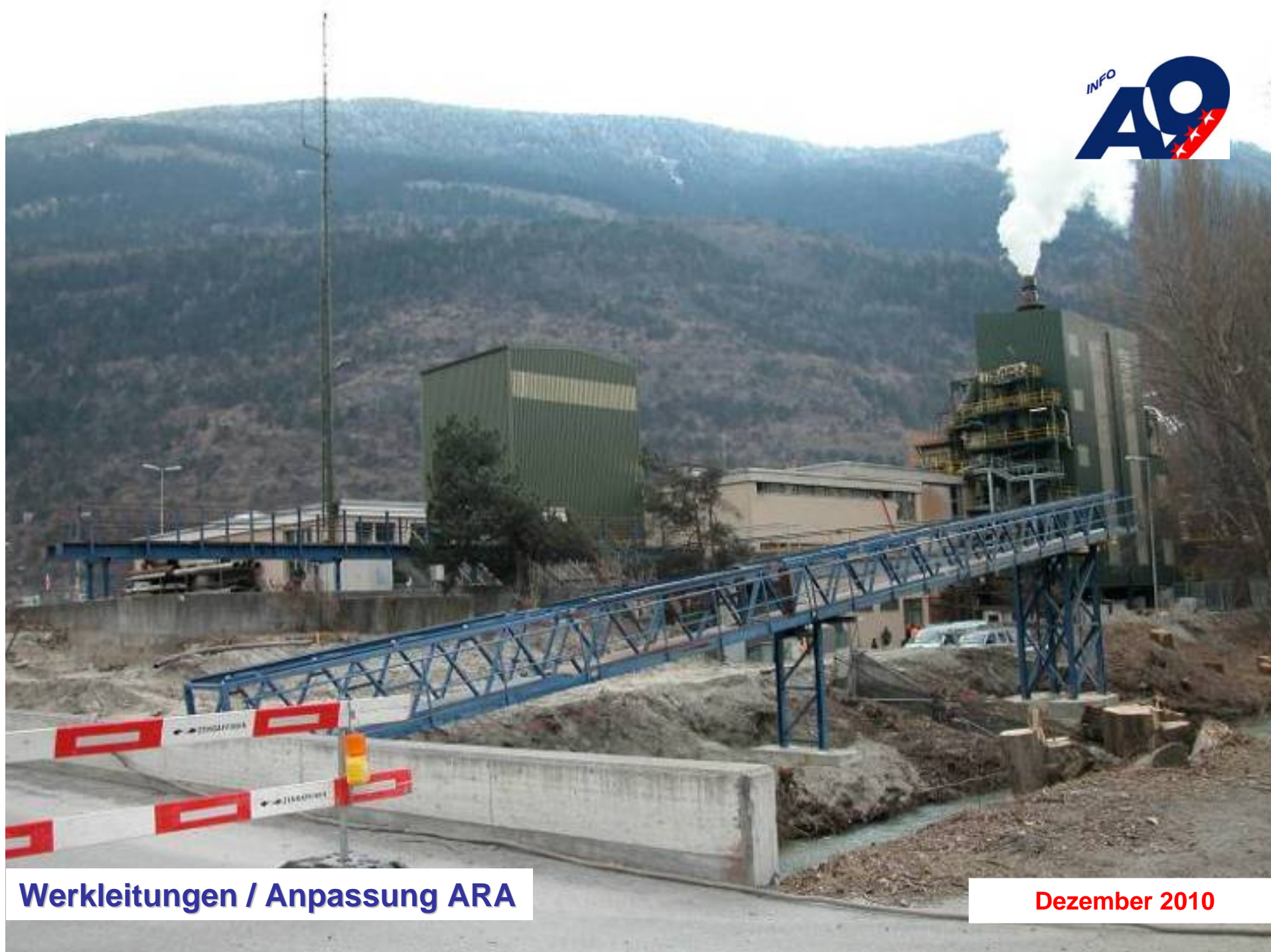
Werkleitungen / Anpassung ARA