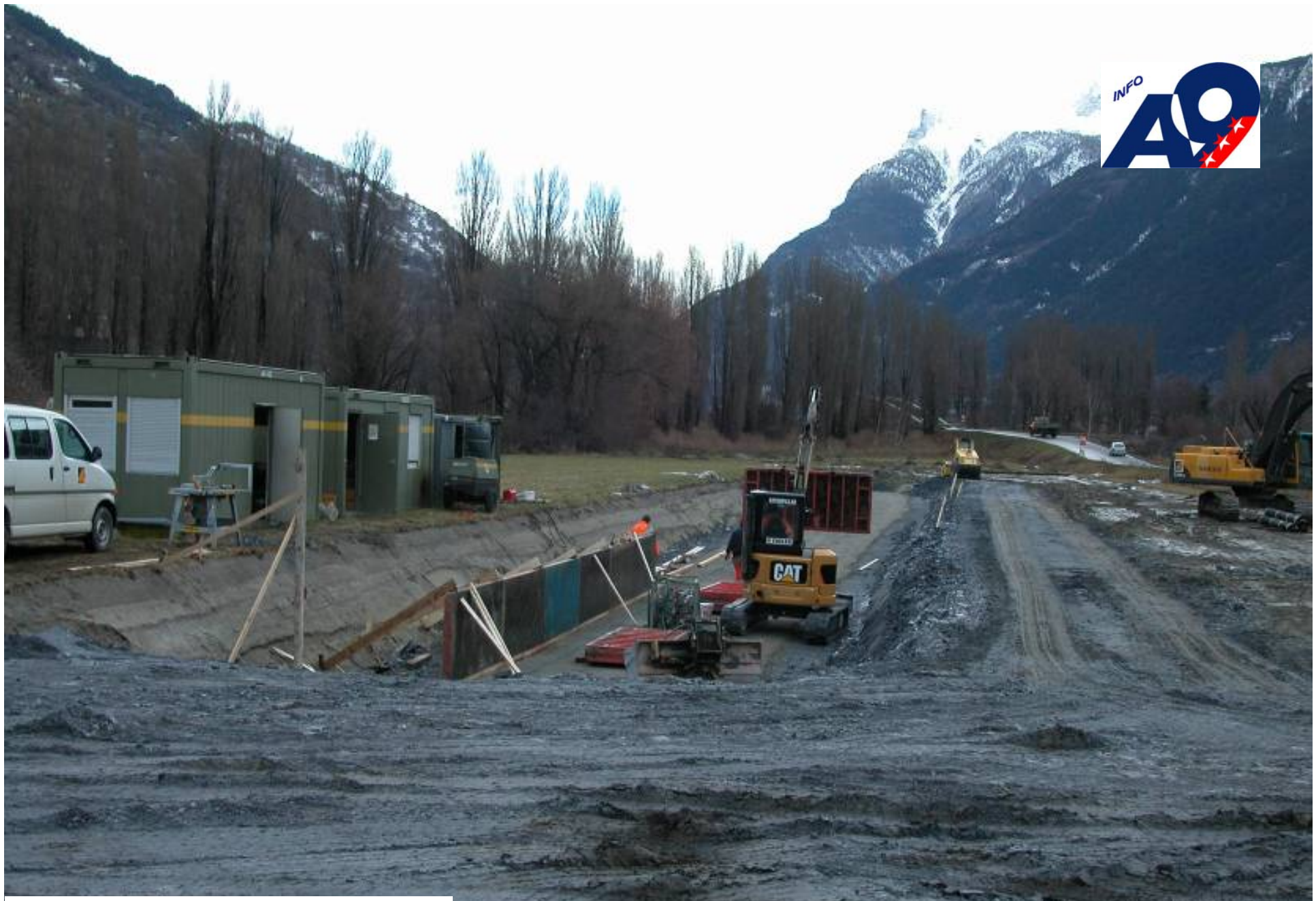
Wereya Vorschüttung Ost