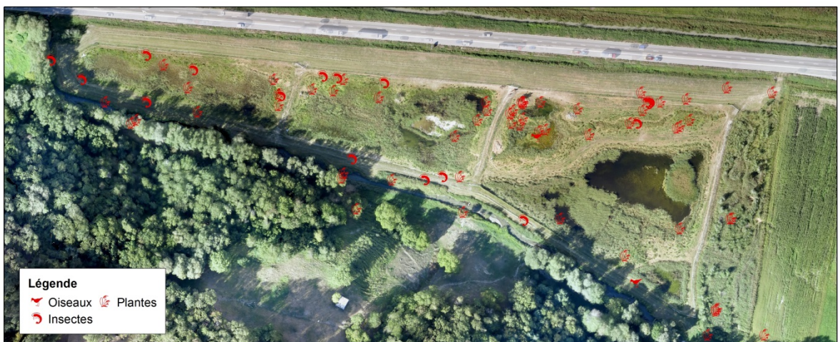
Beobachtungen gefährdeter Arten im Turtiggrund nach der Revitalisation; Orthophoto von 2018