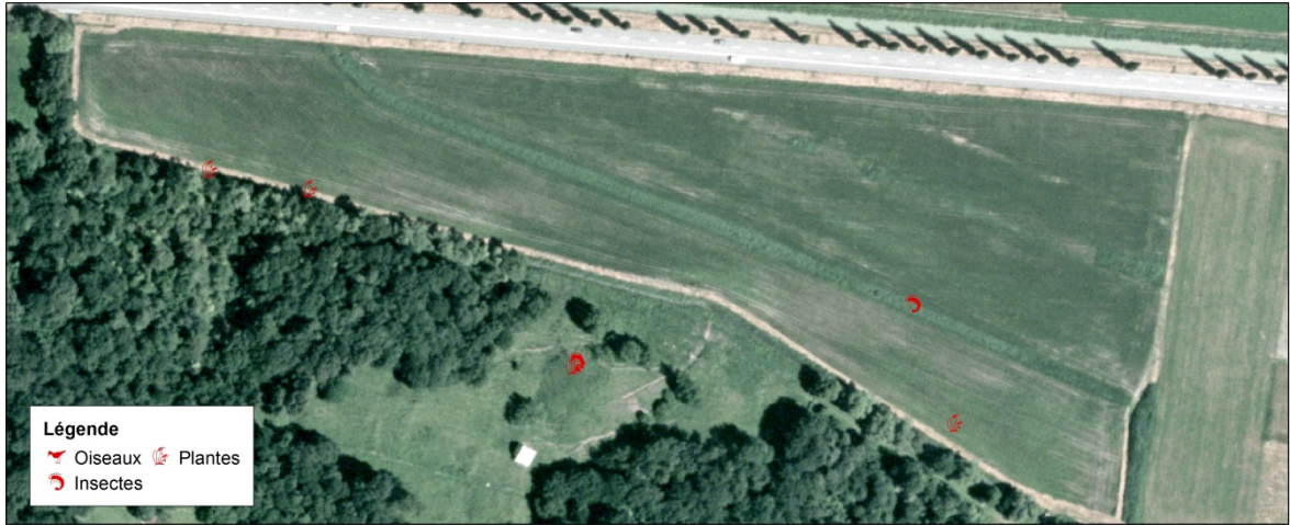
Beobachtungen gefährdeter Arten im Turtiggrund vor der Revitalisation; Orthophoto von 1999